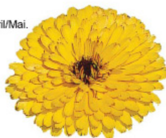
Calendula 'Gitane Yellow'

Einjährig, mit sehr guter Freiland eignung. Aussaat ab Februar für Blüte im April/Mai. Ein frühzeitiger Hemmstoffeinsatz kann den Pflanzenaufbau verbessern. Die Kultur sollte in gut gelüfteten Gewächshäusern bei Temperaturen von 5 - 8 °C erfolgen. Der Einsatz von Zusatzlicht ist vorteilhaft. Eine Jährund-Kultur im Gewächshaus ist möglich. Für eine Blüte im März muss im Januar ausgesät werden; Augustaussaaten blühen im November, Oktobersaaten im Februar. Mit 140 g/100 m 2 ist eine Direktsaat ins Freiland möglich. In Plugs angezogene Pflanzen sollten mit 35 - 50 Pflanzen/m 2 ausgepflanzt werden.