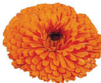
Calendula 'Gitane Orange'