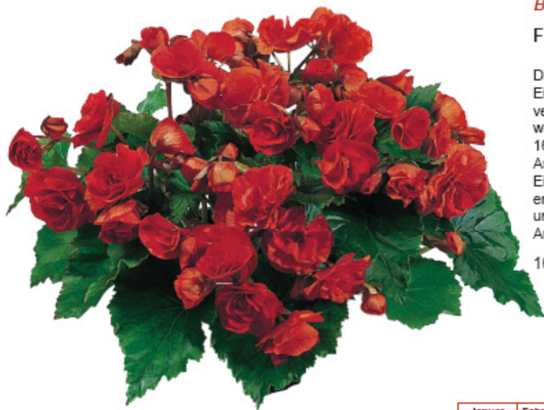
Begonia F1 'Charisma Scarlet'