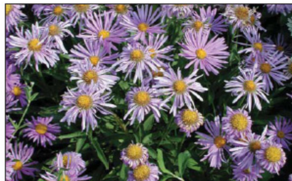
Aster Alpinus 'Superbus Goliath'