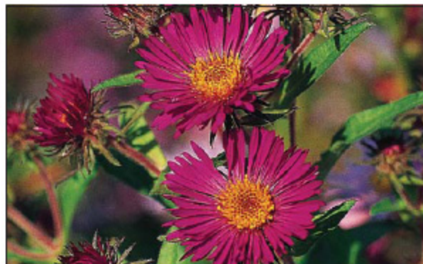
Aster novae - angliae 'Septemberrubin'

novae - angliae 'Septemberrubin', 120 cm, sehr reich blühend mit purpurroten Blüten; gute Schnittneigung. Blüte September - Oktober. Raes Special Mix , 140 cm, neue und verbesserte Mischung aus A. novae-angliae und A. novii-belgii .