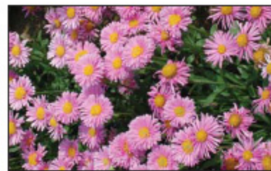
Aster Alpinus 'Happy End'