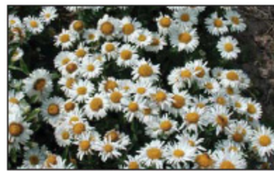
Aster Alpinus 'Superbus Weiße Schöne'