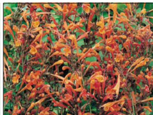
Agastache 'Apricot Sprite'