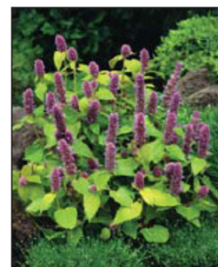
Agastache 'Golden Jubilee'