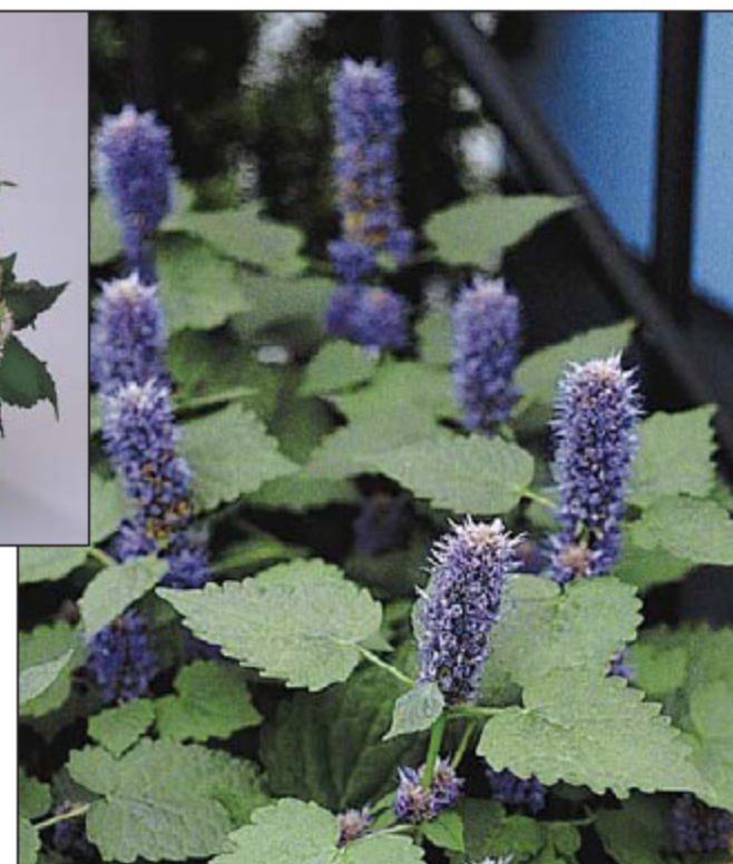
Agastache 'Blue Spike'