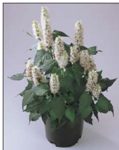
Agastache 'Snow Spike'